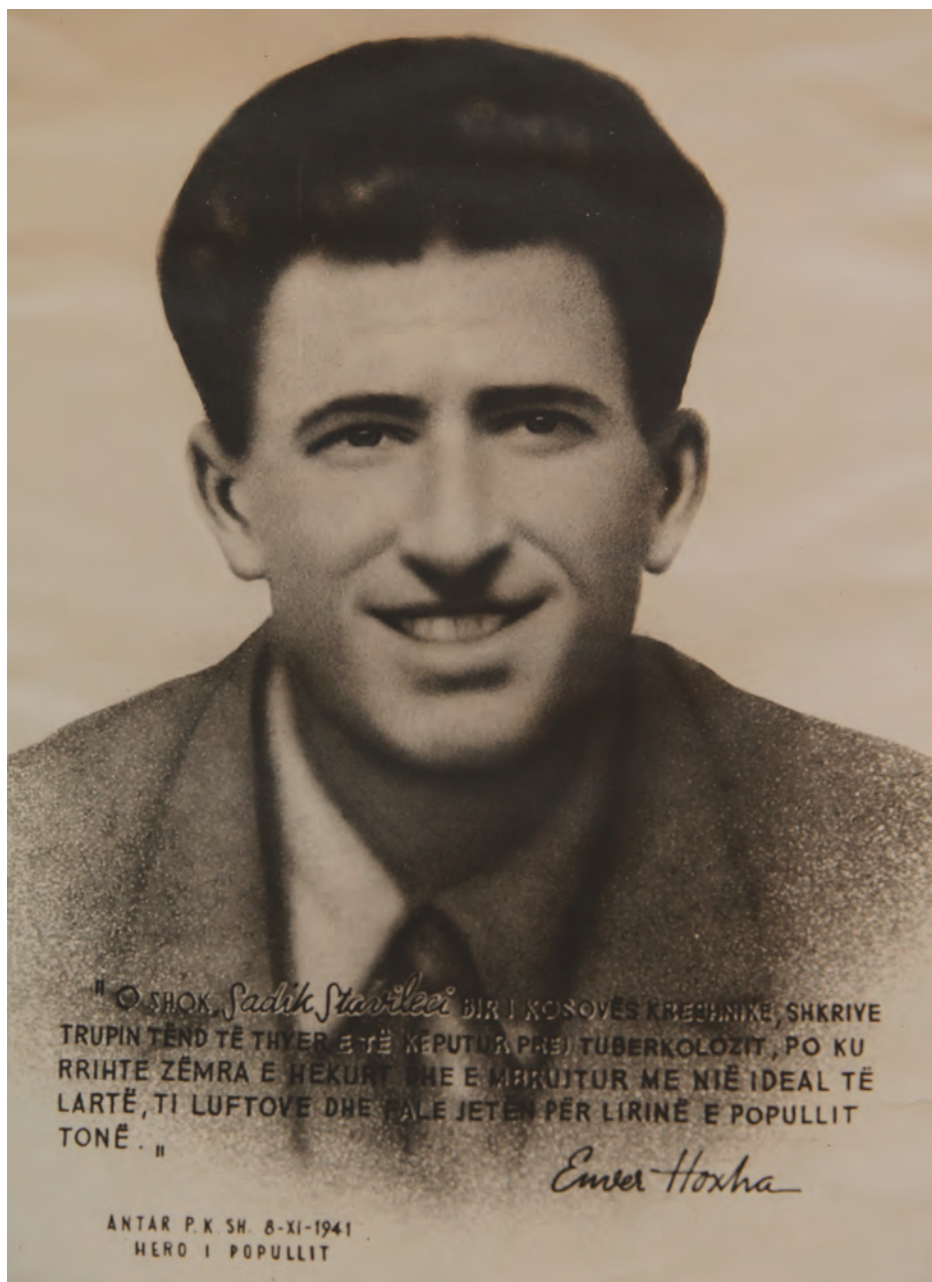
Sadik Stavileci, hero i kombit.